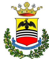
Comune di Voghera