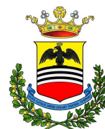
Comune di Voghera